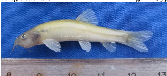
Fig. 3. Schistura kottelati

La determinarea unor specii problematice au fost antrenați specialiști de talie internațională ca M. Kottelat și J. Freyhof. În curs de verificare și confirmare a apartenenței specifice sunt încă doi taxoni din familia Cyprinidae (Tabelul 3.1.).