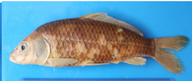
Fig. 2. Cyprinus hieni