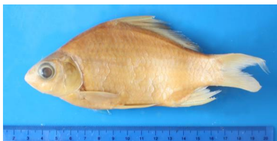
Fig.1. Carassioides phongnhaensis

Pe parcursul studiului efectuat în bazinul fluviului Gianh din Quang Binh (nord-centrul Vietnamului), au fost determinate 181 de specii de pești ce aparțin la 139 de genuri, 64 familii și 16 ordine. S-au identificat 3 specii noi pentru știință : Schistura kottelati Tuan et al., 2015; Carassioides phongnhaensis Tu & Tuan, 2003 și Cyprinus hieni Tu & Tuan, 2003 (Figura 1,2,3).