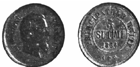
Piesa de 5 sutimi din 1864, cu efigia domnitorului pe avers.

aceiași an și trimise în țară în număr foarte mic, ca exemplare de probă, dar și ele nu au ajuns să fie puse în circulație.