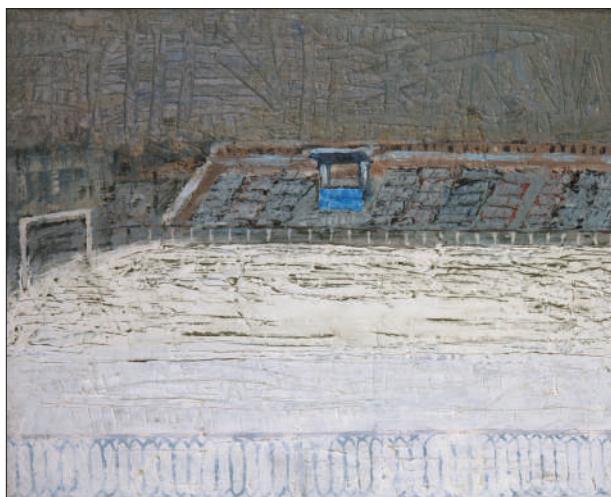
Stadionul „Dinamo”, 2007–2008, u. p., 50 × 40,5 cm.

cromatică rezumându-se la alb-gri. În manieră impresionistă, cu o gamă redusă de culori și cu multiple nuanțe de gri este realizată lucrarea Lacul Valea Morilor (2012). Barca solitară în mijlocul stufului ce apare în compoziție te duce cu gândul la cei care au părăsit-o.