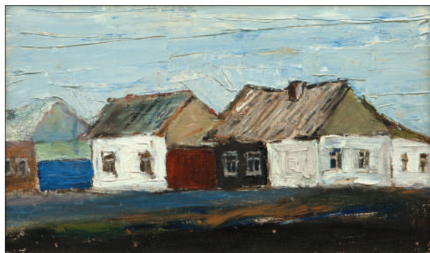
Str. Lev Tolstoi . 2007, u. p., 21 × 35 cm.