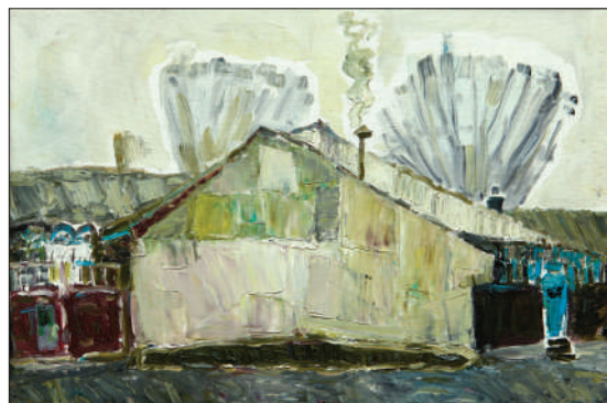
Chișinău. Str. Alexandru cel Bun 105 , 2015, u. p., 60 × 40 cm.

onează artistul, riscă să distorsioneze imaginea Chișinăului ca una ancorată într-un trecut ce continuă să-i confere individualitate și frumusețe.