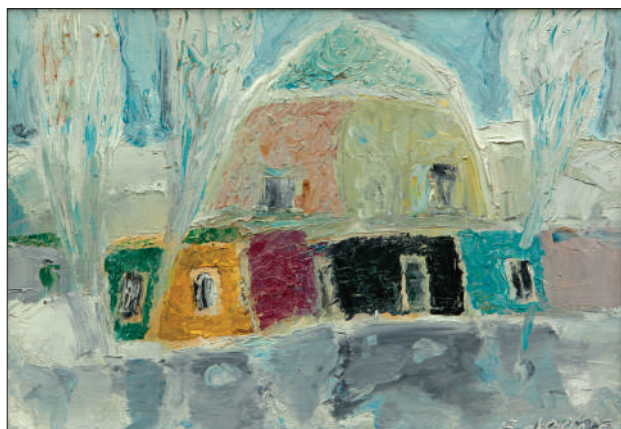
Chișinăul vechi , 2018, u. p., 32 × 46 cm.