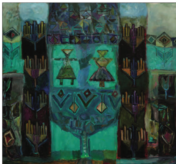
Motiv popular II , 2015, u. p., 148 × 140 cm.