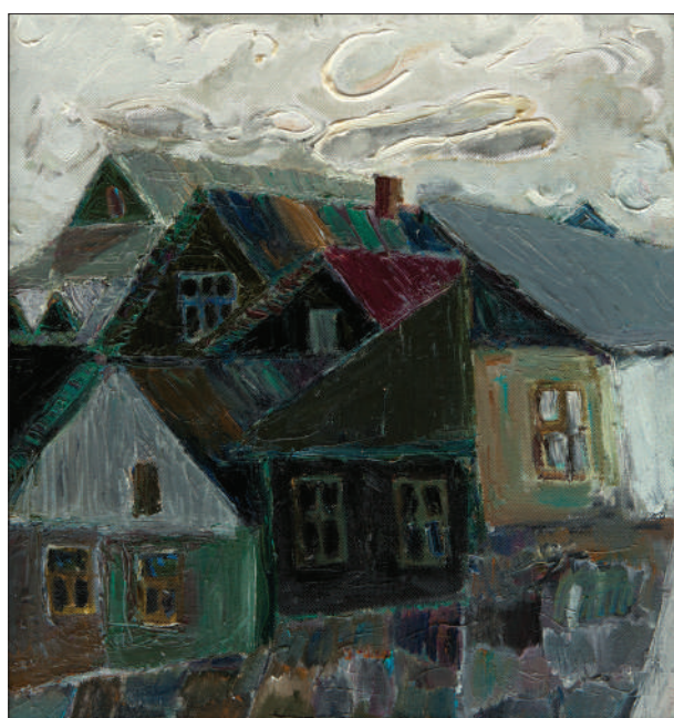
Chișinău. Str. Chițcani, 2015, u. p., 52 × 55 cm.