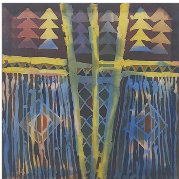
Ochiul lui Zamolxis , batic, mătase, 2014, 100 × 100 cm.

rând până la râul Bâc și mergând spre Biserica Măzărache, străzile Vasile Alecsandri și Ismail” [4]. Captivat de arhitectura veche a caselor ascunse de ochii trecătorilor prin curți, păstrând aura timpurilor trecute, dezvăluie decalajul dintre arterele centrale urbane și căsuțele îmbătrânite, risipite prin străzile lăturalnice cu fațadele și ogrăzile rămase din perioada interbelică. Gamă nuanțată de griuri în care sunt realizate lucrările sale miniaturale Chișinăul vechi, str. Diordița (2013), Curte din Chișinău, str. Serghei Lazo 4 (2014), Chișinăul vechi, str. București (2014), Chișinăul vechi, str. București 77 (2015), pare să încetinească scurgerea timpului. Curțile urbane și casele joase pictate în manieră impresionistă sunt mărturii ale unui cotidian frumos prin enigmele pe care le comportă: Curte din Chișinău, str. Serghei Lazo 4 (2014), Chișinăul vechi, str. București (2014) ș.a. Denumirile lucrărilor, ce indică adrese concrete, impri-