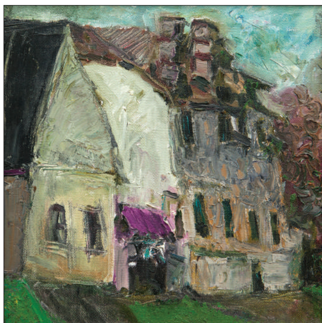
Str. Sf. Andrei, Chișinău , 2015, u. p., 37 × 37 cm.

Pe lângă Chișinăul vechi, Florentin Leancă reflectă în lucrările sale diferite aspecte ale orașului contemporan. Lucrările Stadionul „Dinamo” (2007–2008), Hipodromul din Chișinău (2008), Hipodromul din Chișinău (2009), Teatrul de Operă și Balet „Maria Bieșu” , Ziua Corului (2009), Teatrul de Vară (2012), Lacul Valea Morilor (2012), Peisaj de toamnă, str. Nicolae Dimo (2013), Chișinău. Casa Limbii Române „Nichita Stănescu” (2015) ș.a. reactualizează un oraș activ, implicat în diverse activități culturale și sportive. Stadionul „Dinamo” , o achiziție (2013) a Muzeului Național de Artă a Moldovei, abordează situația deplorabilă în care s-a pomenit un obiectiv emblematic al Chișinăului, altădată plin de energie și de acțiune, astăzi aflat în paragină. Artistul pune accentul pe diversitatea facturii, gama