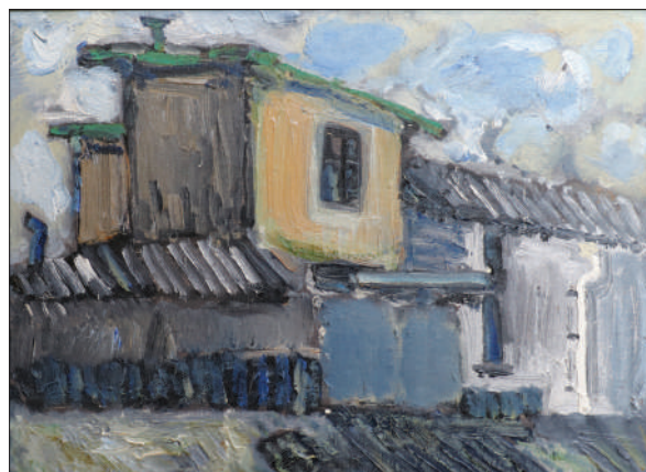
Chișinău, str. Bălți , 2011–2014, u. p., 30 × 40 cm.

mă un plus de valoare documentară imaginilor. Artistul încearcă să transpună nu numai starea de liniște a străzilor și caselor încremenite parcă în timp, dar și pitorescul elementelor arhitecturale tradiționale de altădată – geamuri, uși și balcoane, frontoane, porți cu piloni etc.