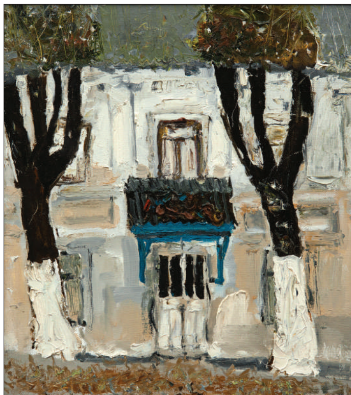
Chișinăul vechi, str. Diordița , 2013, u. p., 48 × 43 cm.

NOTĂ. Articolul este elaborat în cadrul Programului de stat: 20.80009.0807.19 Cultura promovării imaginii orașelor din Republica Moldova prin intermediul artei și mitopoeticii , Universitatea de Stat din Moldova.