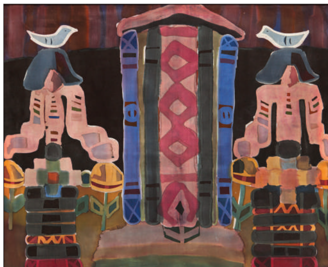
Sărbătoare , 2016, batic, mătase, 80 × 100 cm.

prim-plan trei săgeți amplasate vertical pe care, potrivit mitului, erau aduși în jertfa lui Zamolxis mesagerii.