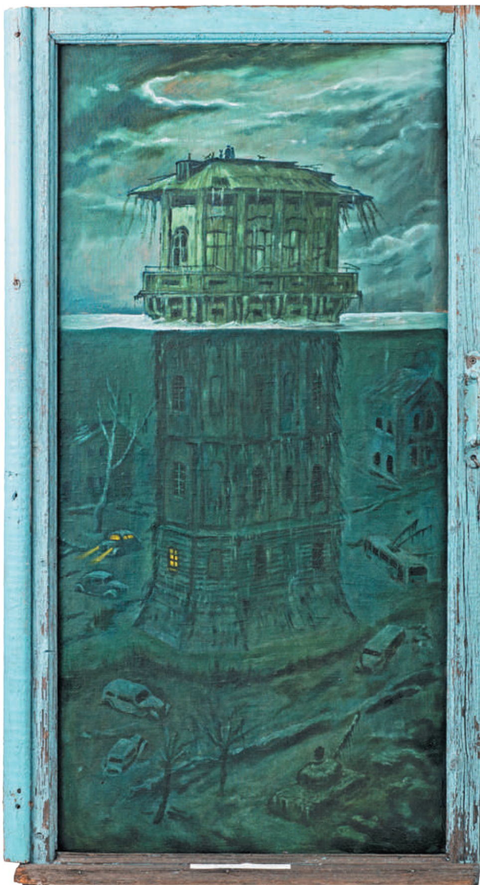
Mark Verlan, Turnul de apă al lui Bernardazzi , 2015, ulei, pânză, 500×700 mm.