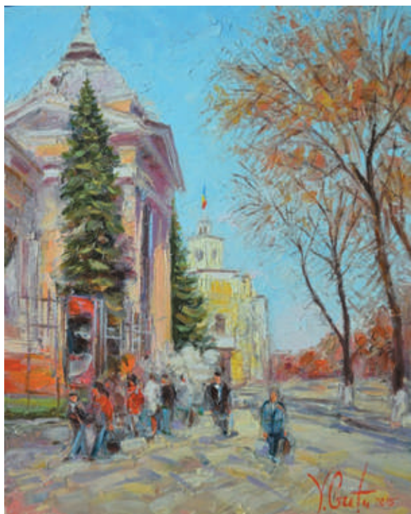
Victor Crețu, Chișinău. Orașul vechi , 2015, ulei, pânză, 300×240 mm.