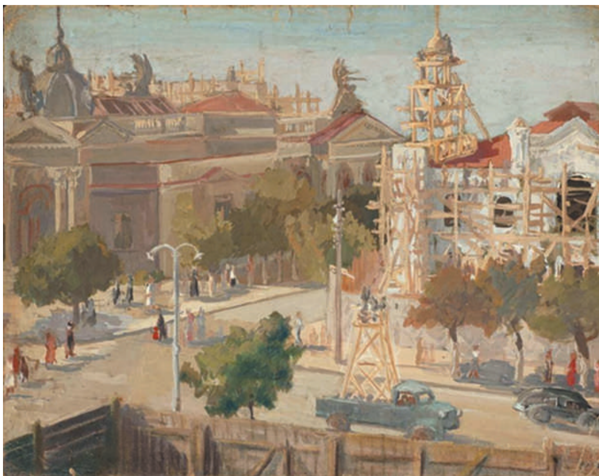
Eugenia Gamburd, Ruinele oraşului , 1945, guaşă, pânză, carton, 380×285 mm [1].