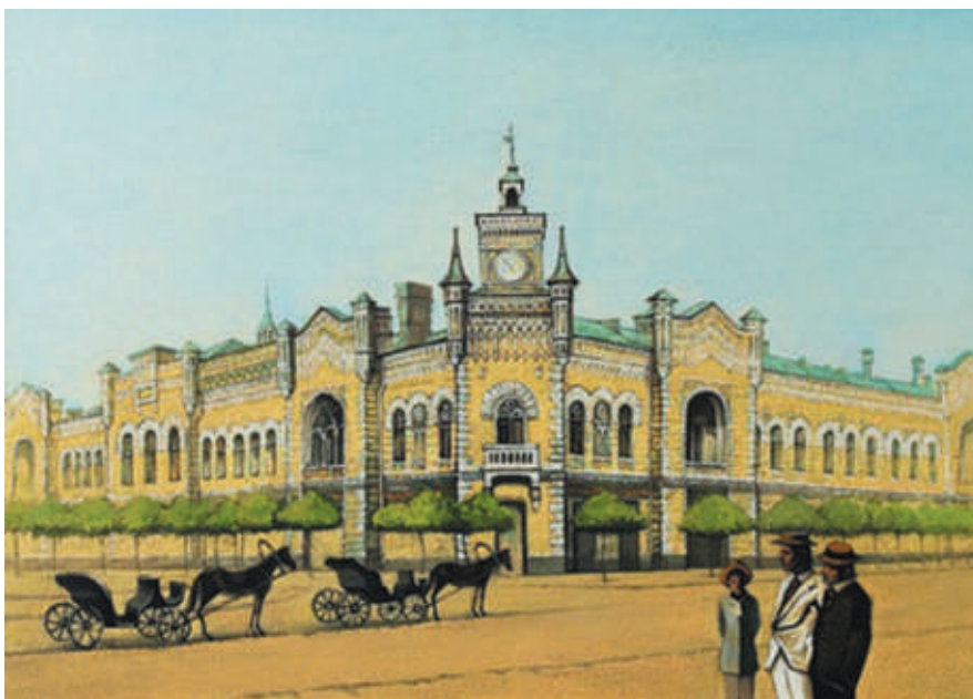
Ghenadie Șonțu, Duma orășenească , 2009, ulei, pânză, 600×700 mm [4].

de Stat cu sculptura de pe fațada principală a frontonului. Deși au reprezentat orașul distrus, E. Gamburd, Gr. Fiurer și A. Baranovici au dorit să creeze o atmosferă de optimism și de încredere în forța de reabilitare a poporului.