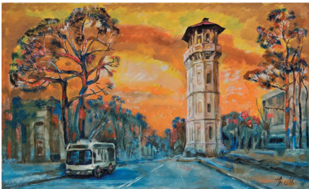
Gheorghe Munteanu, Turnul de apă , 2008, ulei, pânză, 1300×780 mm.

amintind mai mult o zonă rurală, fără drumuri pavate sau alte elemente urbane moderne.