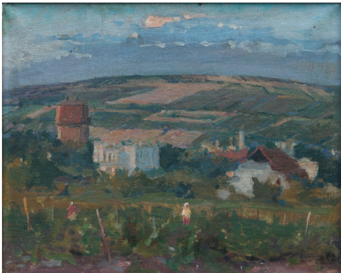
Alexei Vasiliev, Împrejurimile Chișinăului , 1945, ulei, pânză, 350×430 mm [1].