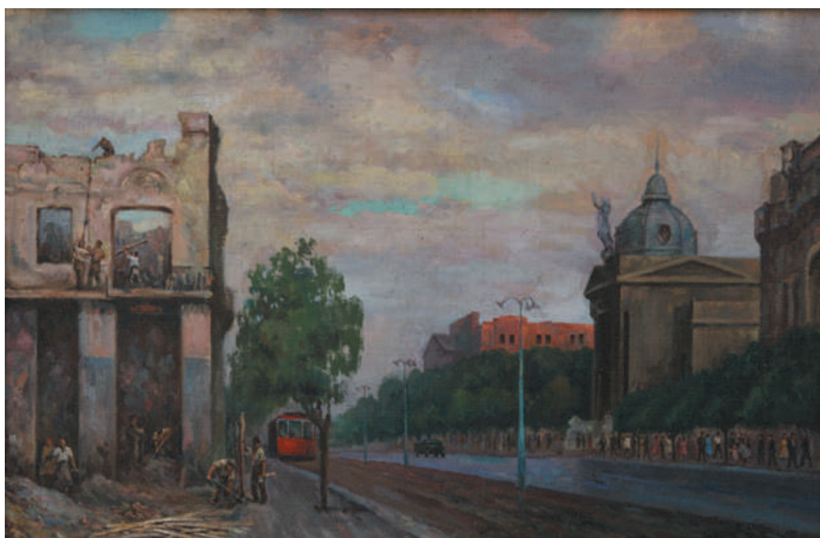
Grigore Fiurer, Chişinăul postbelic , 1946, ulei, pânză, 670×1020 mm [1].