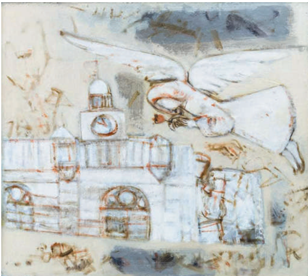
Arcadie Antoseac, Siluetele oraşului , 2009, ulei, tehnică mixtă, 800×600 mm.