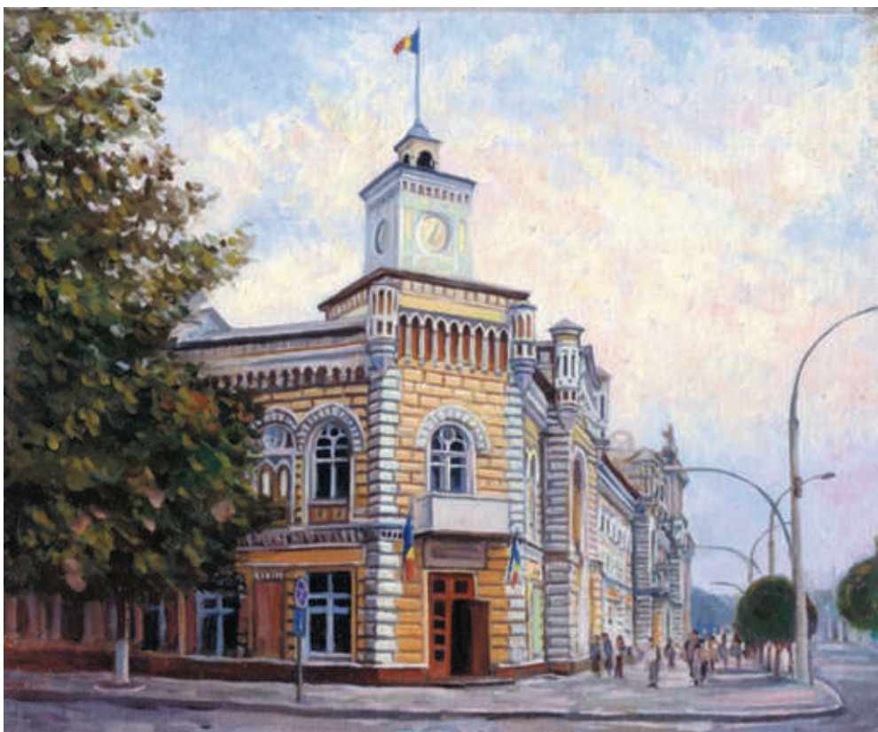
Victor Crețu, Primăria , 2006, ulei, pânză, 800×600 mm.