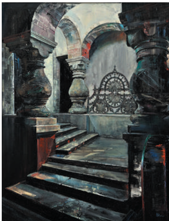
Dmitri Șibaev, Trepte și stâlpi I , 2020, ulei, pânză, 1300×1000 mm.

Ilustrul arhitect Al. Bernardazzi a lăsat Chișinăului opere de artă, unele dintre care rămân și până azi izvor nesecat de inspirație pentru artiști plastici. Pe parcursul istoriei sale Chișinăul a fost înveșnicit în diverse ipostaze ale dezvoltării urbanistice: oraș cu o bogată arhitectură distrusă după bombardament în lucrările plasticienilor E. Gamburd, Gr. Fiu-