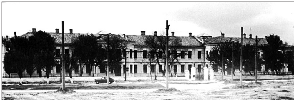
• Institutul de Stat de Medicină din Chișinău, 1945/1946