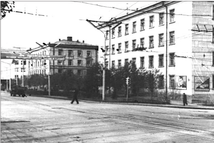
• Căminele ISMC amplasate pe bd. V.I. Lenin, 1966