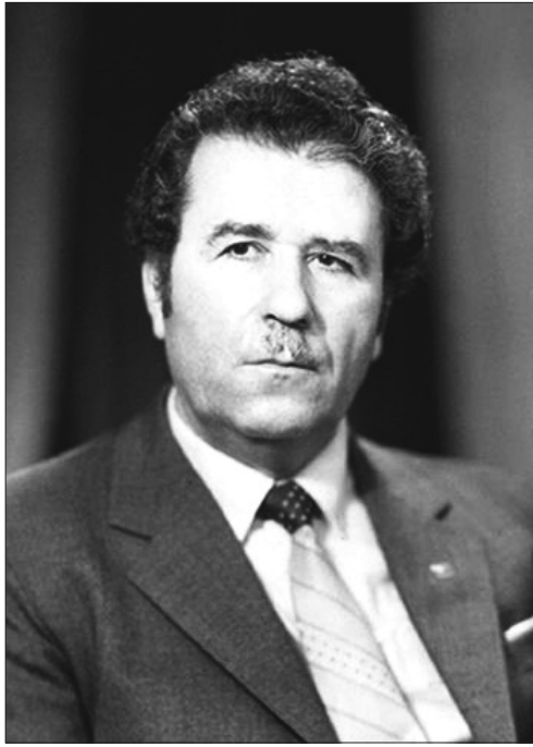
• Nicolae Testemițanu, rectorul ISMC (1959-1963)