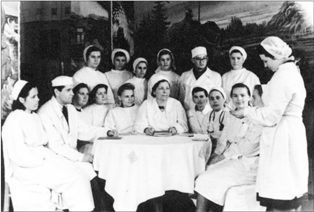
• Un seminar de pediatrie la Institutul de Stat de Medicină din Chișinău, 1957