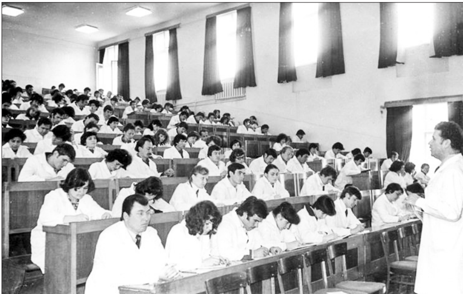
• Profesorul universitar Nicolae Testemițanu la o prelegere