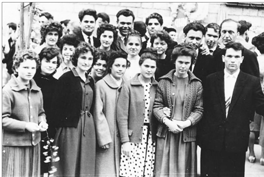
• Studenți de la Institutul de Stat de Medicină din Chișinău la sărbătoarea de 1 Mai, 1961