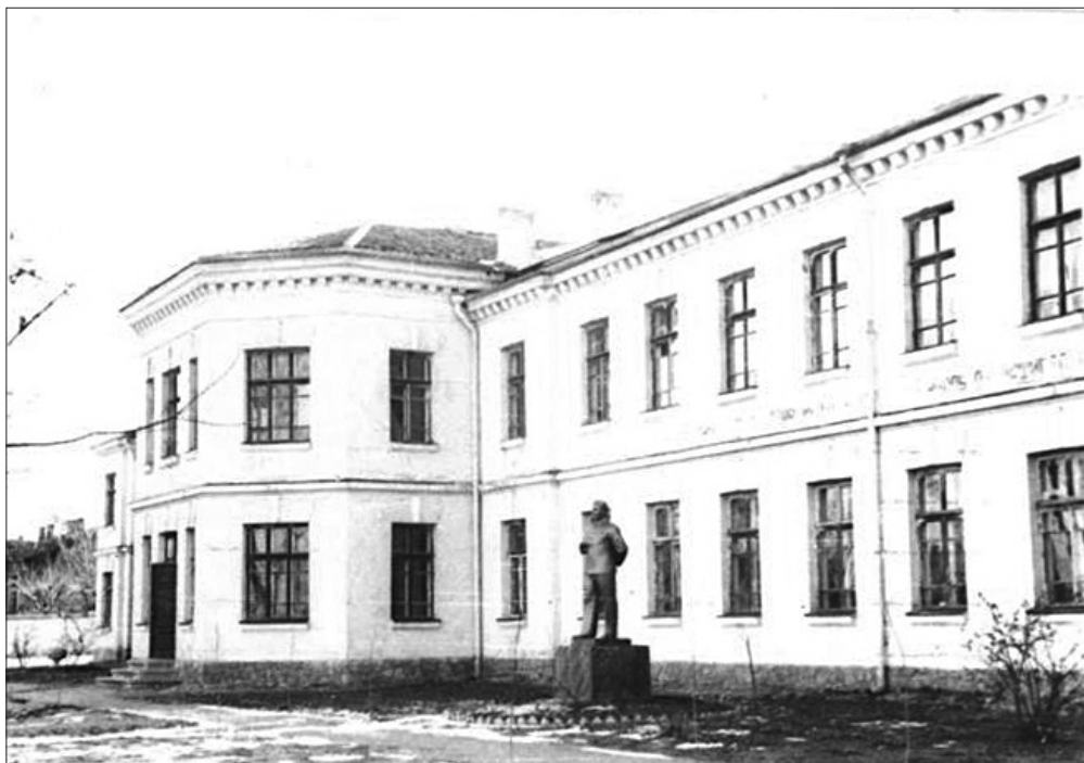
• Aspectul Blocului Central. În centru – statuia lui I.V. Stalin, octombrie 1957