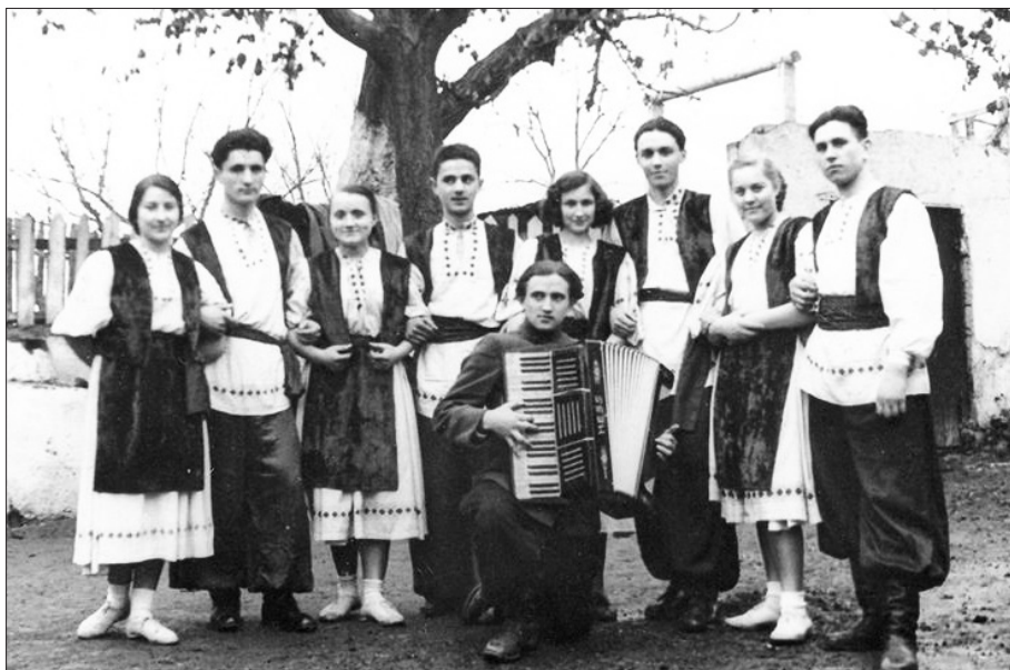
• Cercul de dansuri, 1955