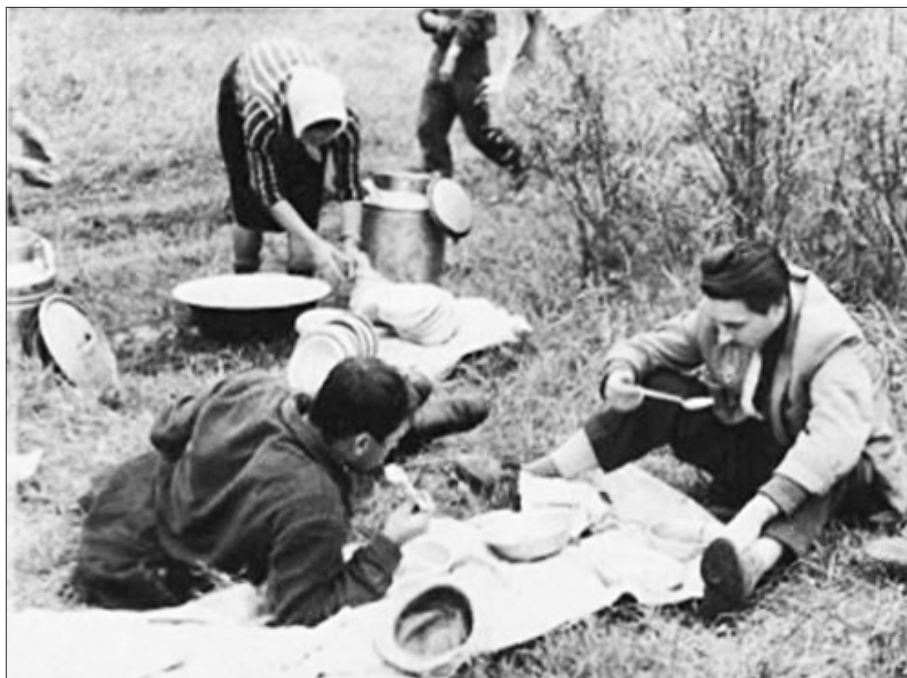
• Studenți la masa de prânz, după culesul strugurilor. S. Țibirica, raionul Călărași, octombrie 1964