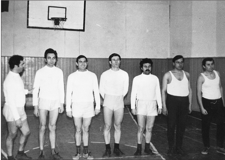
• Echipa de baschet a Facultății de Medicină Preventivă, corpul profesoral-didactic, 1976