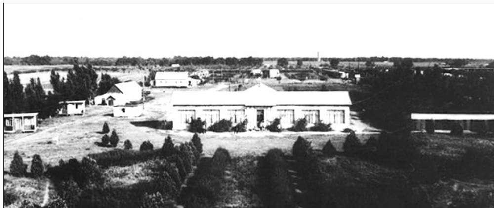
• Tabăra sportivă de asanare a sănătății Medicul. Sergheevka, RSS Ucraineană, 1968