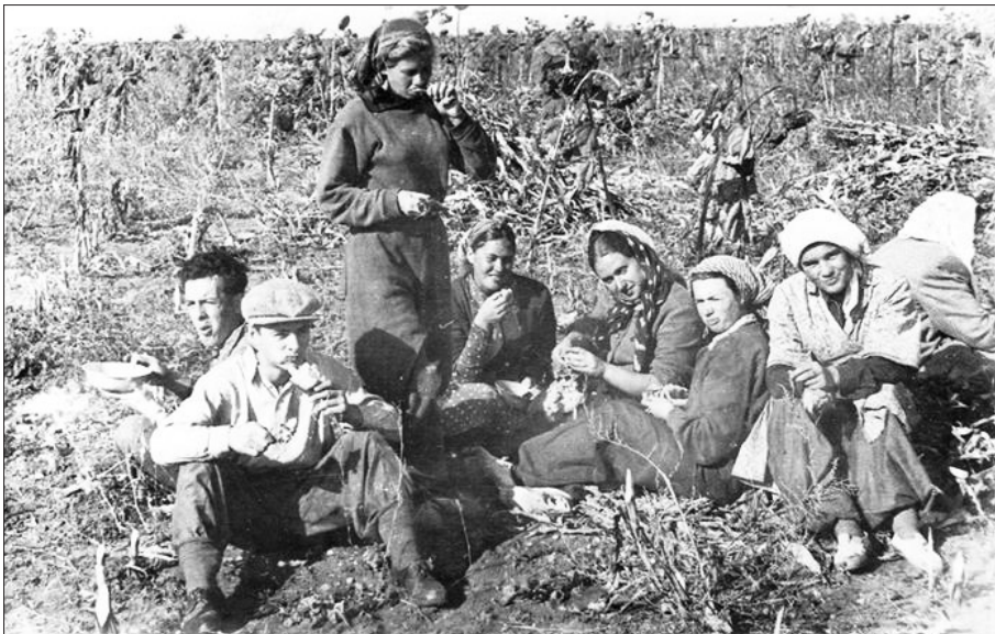
• Studenți de la ISMC la lucru în colhoz, anii '60