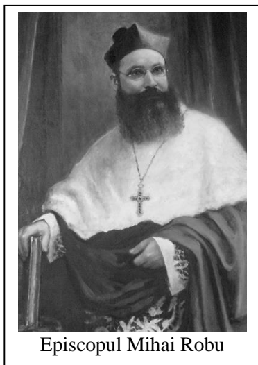
Episcopul Mihai Robu

A doua vizită canonică în Parohia Chișinău a episcopului Mihai Robu a avut loc în octombrie 1934. La