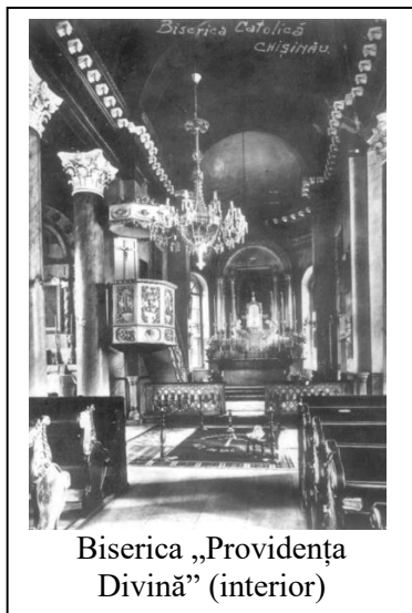
Biserica „Providența Divină” (interior)

Situația nu s-a schimbat nici peste doi ani, întrucât, scriindu-i episcopului de Iași la 13 decembrie 1933, îi relatează că grija pastorală este din ce în ce mai dificilă, mai ales în ceea ce ține de sacramentul Căsătoriei și „trebuie să fie speriați de moarte pentru a se apropia de altar... Pretutindeni doar egoism și materialism puternic” [23, f.96].