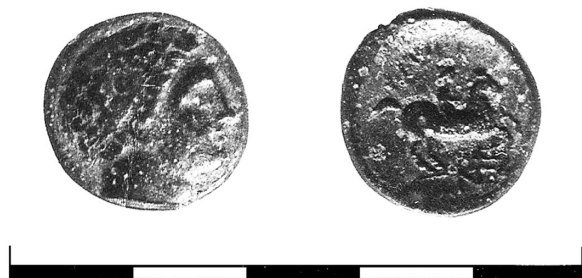
Fig. 2. Moneda descoperită la Tudora.

ΦΙΛΙΠΠΟΥ, iar în partea inferioară monograma NE (Мелюкова 1958a, 31-32; Мелюкова 1958b, рис. 23/15) 1 . Modul de reprezentare a monedei ar presupune un raport de cca 45° între avers și revers (fig. 2). Autorul cercetărilor considerase atunci că ceramica din secolele IV-III a. Chr. și moneda au putut fi aduse pe suprafața sitului Tudora I, de locuitorii sitului Tudora II (Мелюкова 1958a, 32).