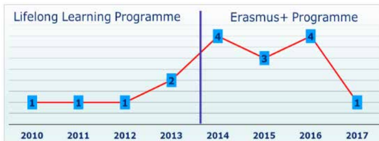
Figura 2. Dinamica proiectelor Jean Monnet din Republica Moldova, 2010-2017

În această ordine de idei, în perioada 2010-2018 în țară au fost implementate 17 proiecte Jean Monnet, acestea având o importanță inestimabilă în aprofundarea cunoștințelor despre politica, viața economică, socială și culturală a Uniunii Europene (a se vedea dinamica în figura de mai jos).