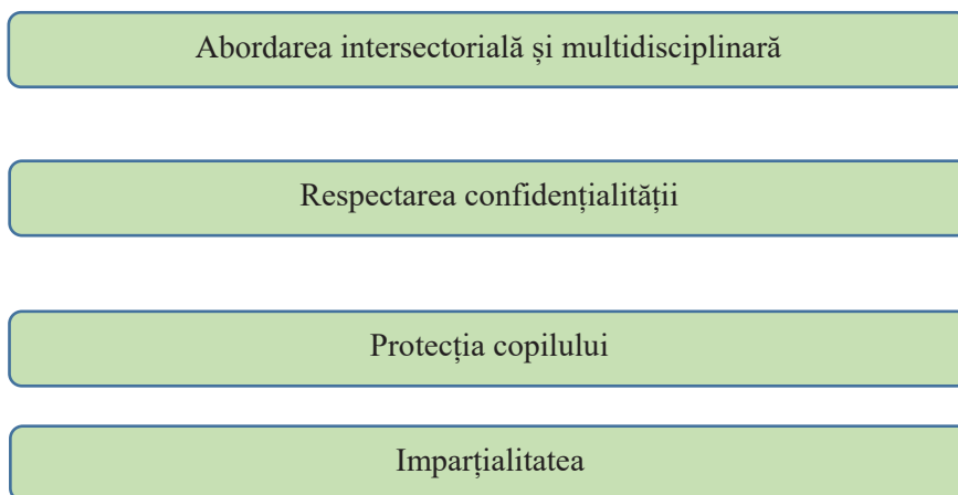
Fig. 2. Principiile care stau la baza activității psihologului școlar și a logopedului

Chiar dacă aceste principii reprezintă un pilon al serviciilor specializate în instituțiile școlare, se impune clarificarea anumitor aspecte ce țin de asistența cu privire la limbajul elevilor. În majoritatea cazurilor, sistemul interacțional al logopedului și psihologului școlar se referă la elevii cu tulburări de limbaj și comunicare, implicând și alți participanți din mediul școlar și familial. Dacă ne referim la principiul abordării intersectoriale și multidisciplinare, psihologul și logopedul fac parte din Comisia multidisciplinară intrașcolară în vederea organizării unui proces educațional incluziv de calitate, participând totodată și la elaborarea Planului Educațional Individualizat.