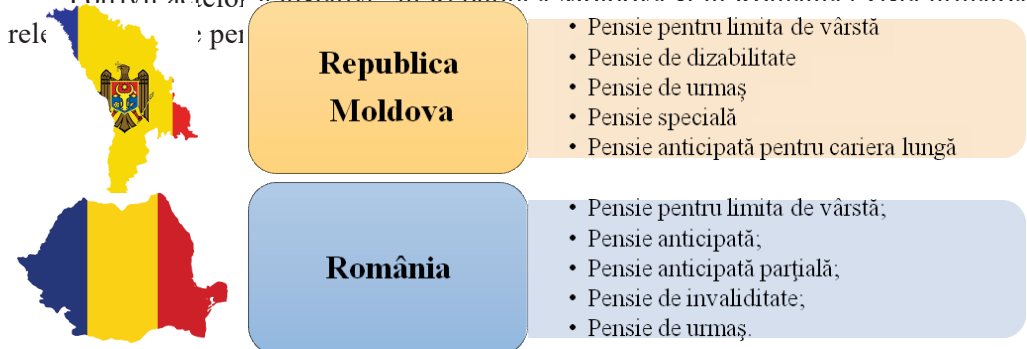
Fig. 1. Categoriile de pensii în Republica Moldova și în România

Potrivit actelor legislative în Republica Moldova și în România există următoarele