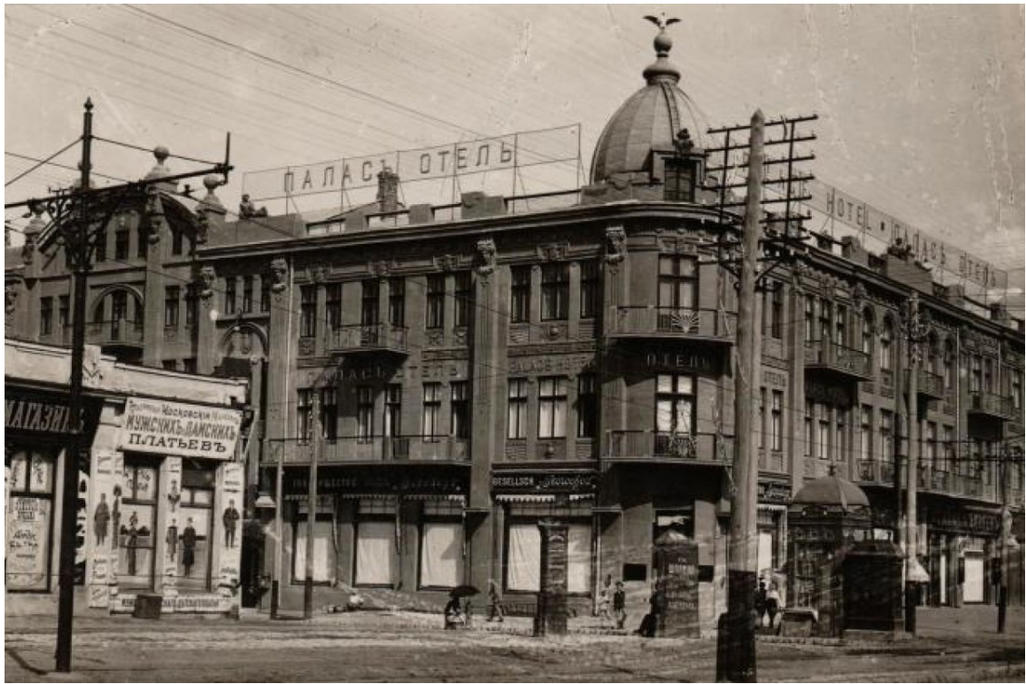
Chișinău, în primii ani ai secolului al XX-lea.

că tatăl lui e moldovean și mama bulgăroaică?”. Cu toții (cu excepția multor ruși) vorbesc mai mult sau mai puțin românește.