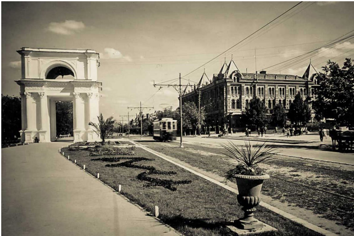
Chișinău, Porțile Sfinte, perioada interbelică.

polul opus celei europene și ca atare străine localnicilor. Totuși, convingerea că basarabienii se vor integra rapid și cu entuziasm în civilizația europeană a suportat pe alocuri fisuri: „Mulți regretă timpurile rușilor”. Cu tot cosmopolitismul capitalei, „Totul ne arată o țară locuită din timpuri străvechi, iar țara aceasta este pur românească”.