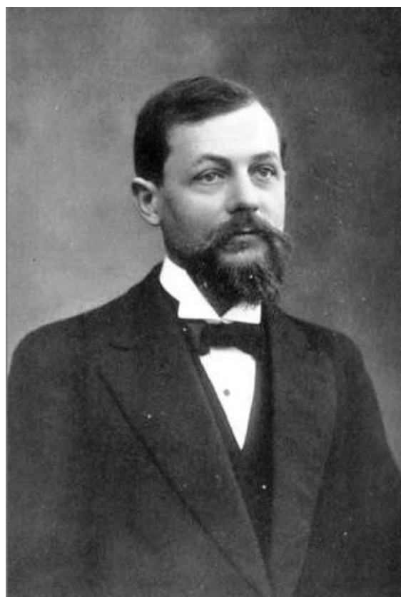
Emmanuel de Martonne, geograf și pedagog francez.

La 1919, Emmanuel de Martonne vedea un Chișinău cu străzi largi ce se intersectau în unghiuri drepte, edificii și parcuri frumoase, cu magazine și muzee. Această viziune dovedea, după el, o sensibilitate urbană modernă. În același timp, cartierele din partea de jos aveau rolul de purtătoare ale informației istorice mai adâncite în timp: „Animația, luminile magazinelor, cafenelele și hotelurile dau impresia unui veritabil oraș. Dar este orașul rusesc, cu aleile nemăsurat de largi, mărginite de case doar cu un etaj; chiar și Hotel d'Angleterre, cu alura de palat foarte corect, chiar și clădirile publice: primăria, comandamentul militar etc. Tot orașul de sus, cu bulevardele sale paralele plantate cu