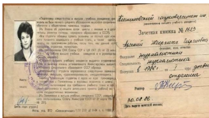
Imaginea 2. Carnet de note al studentului, mostră din anul 1986

Ultima activitate de evaluare care consemna încheierea studiilor superioare era sesiunea de absolvire 3 . Aproximativ peste o lună după încheierea acestei sesiuni, absolvenților li se înmâna diplomele de studii superioare, în care era indicată specialitatea sau specializarea la care a studiat și calificativul care i s-a atribuit absolventului. Nota generală