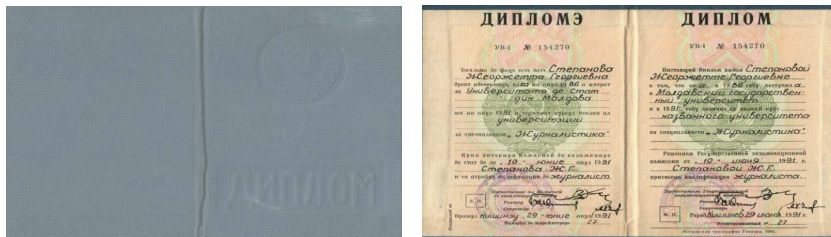
Imaginea 3. Diplomă de studii superioare, mostră din anul 1991

pe anii de studii sau notele de la sesiunea de absolvire nu erau trecute în diplomă(vezi imaginea 3).