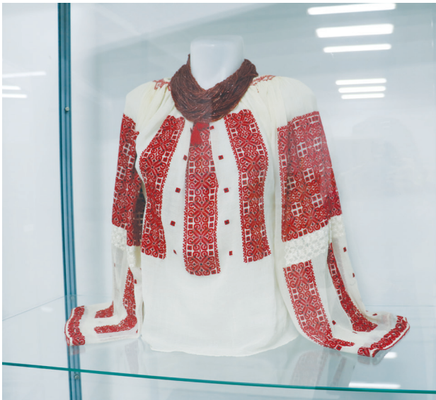
Piese de port popular. Secvențe din expoziția „Promotori ai identității și valorilor naționale”, MNIM, 27 august – 30 septembrie 2022.