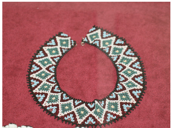
Cămașa cu altiță, podoabe feminine. Secvențe din expoziția „Promotori ai identității și valorilor naționale”, MNIM, 27 august – 30 septembrie 2022.