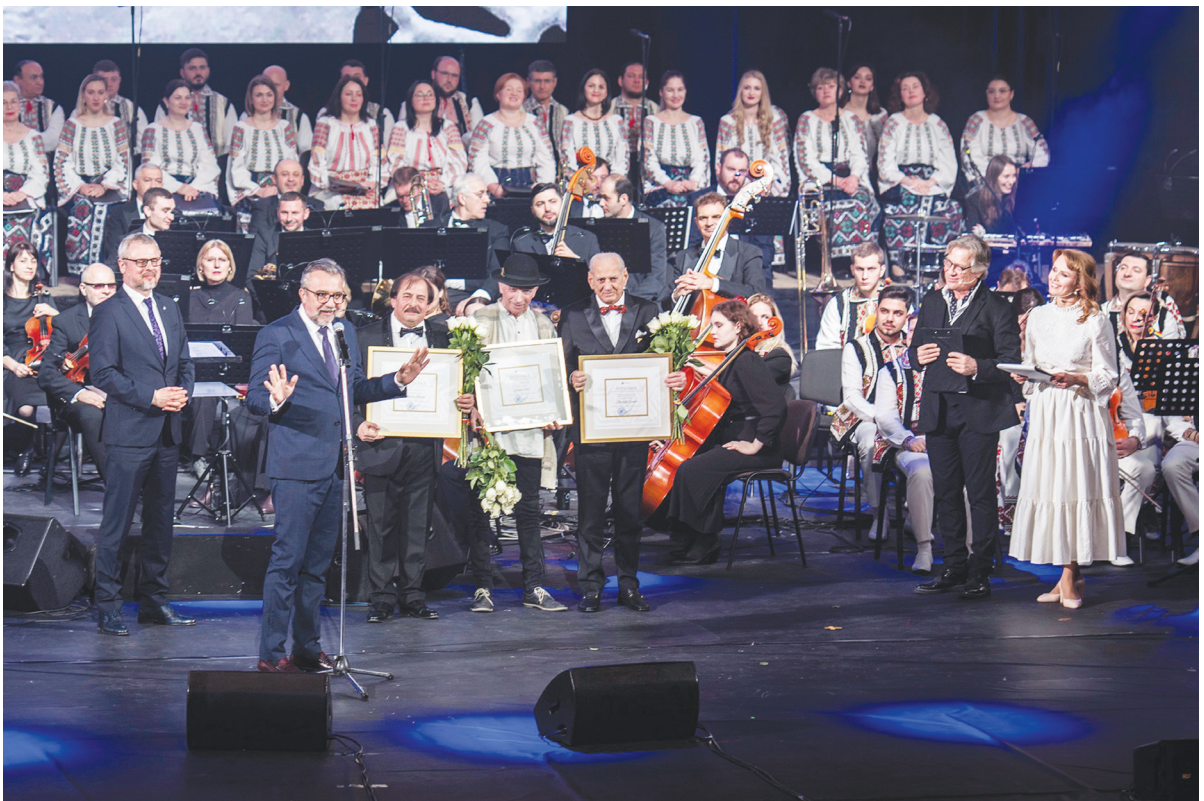
Evenimente organizate cu prilejul sărbătoririi a 105 ani de la înfăptuirea Unirii Basarabiei cu România.