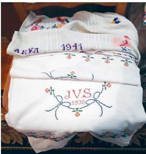
Piese de patrimoniu din perioada interbelică. Colecția Rodica Calistru