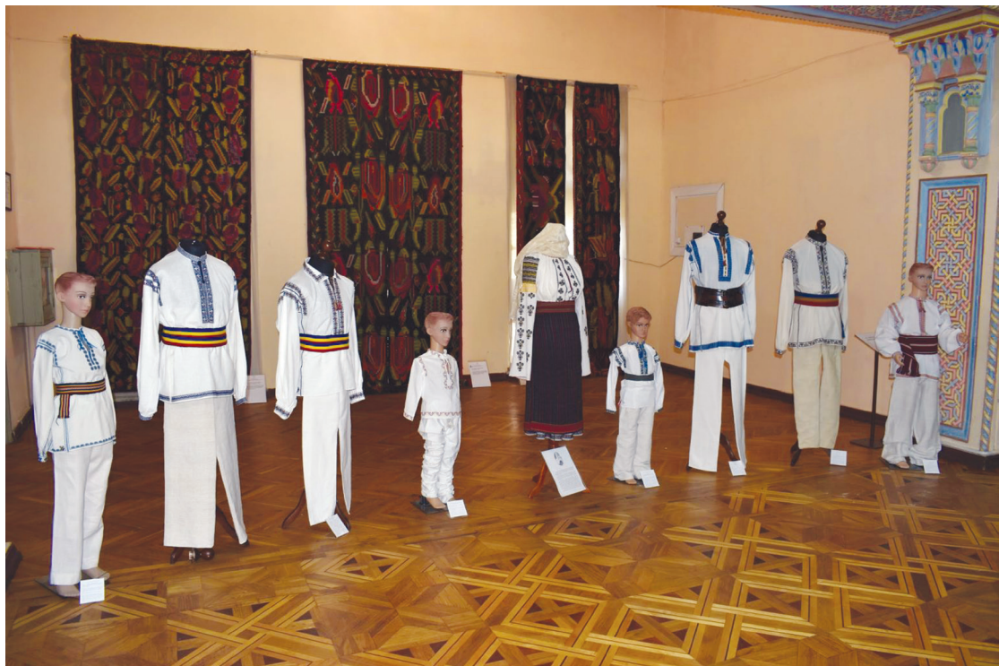
„Cămașa Unirii”. Expoziție organizată cu prilejul celor 103 ani de la Unirea Basarabiei cu România, 26 martie – 10 mai 2021. https://www.muzeu.md/expozitia-camasa-unirii-oferita-publicului-fara-inaugurare/