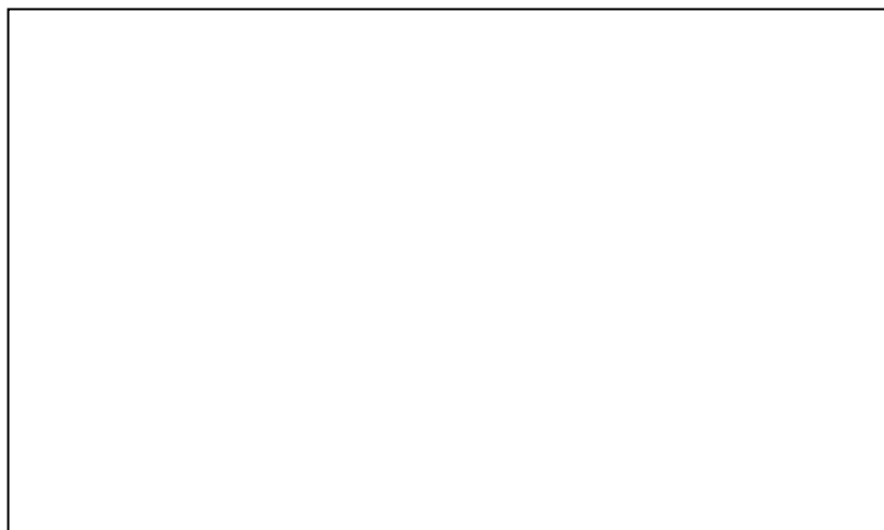
Fig. 1. Nivelul competenței de evaluare formativă la cadrele didactice universitare la etapa de constatare.

În baza rezultatelor obținute se constată că 83% din respondenți consideră că evaluarea formativă este foarte importantă în procesul educațional, 12% evidențiază faptul că evaluarea formativă este mai puțin importantă și 5% din respondenți consideră că evaluarea formativă nu este importantă. Prin urmare, majoritatea cadrelor didactice (83%) susțin importanța evaluării formative în procesul educațional (Figura 2).