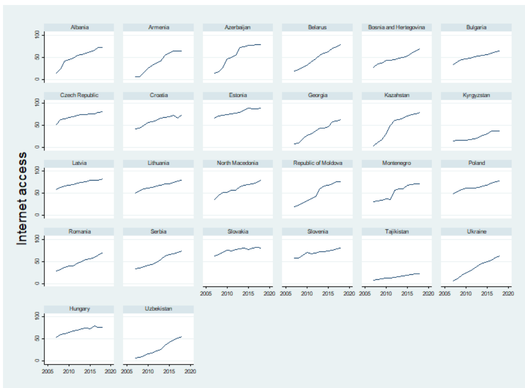
Graficul 6. Evoluția ponderii gospodăriilor cu acces la internet în fostele state socialiste în perioada 2007-2018, %

Sursa: Rezultate generate prin utilizarea limbajului de programare STATA