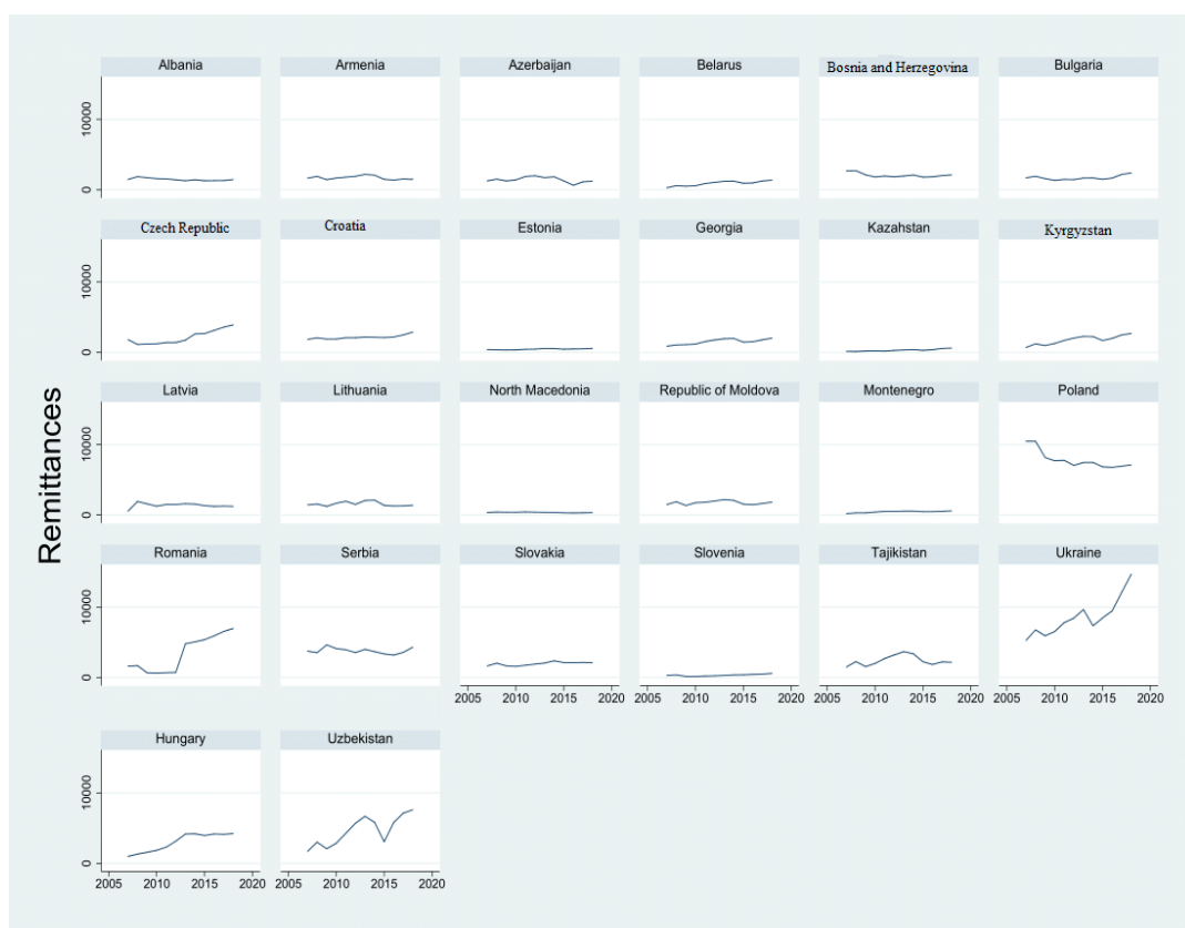
Graficul 1. Evoluția intrărilor de remitențe în fostele state socialiste în perioada 2007-2018, milioane $

Sursa: Rezultate generate prin utilizarea limbajului de programare STATA