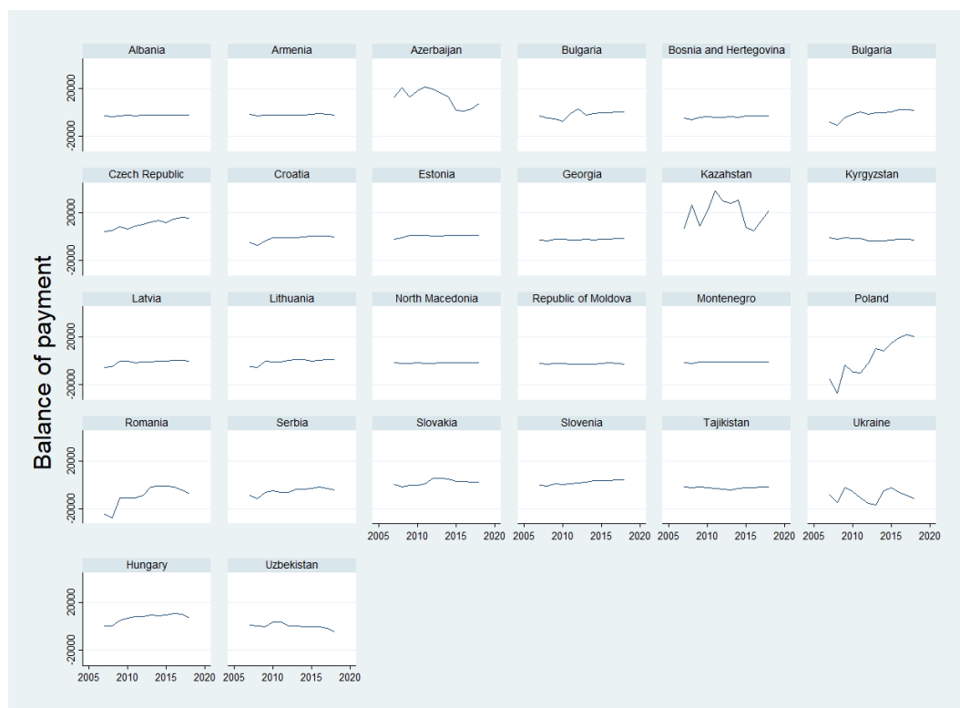
Graficul 5. Evoluția soldului balanței de plăți externe în fostele state socialiste în perioada 2007-2018, milioane $

iar în România – deficitară ( Graficul 5 ), ceea ce evidențiază dependența celei din urmă de importuri în vederea satisfacerii nevoii de consum a populației.