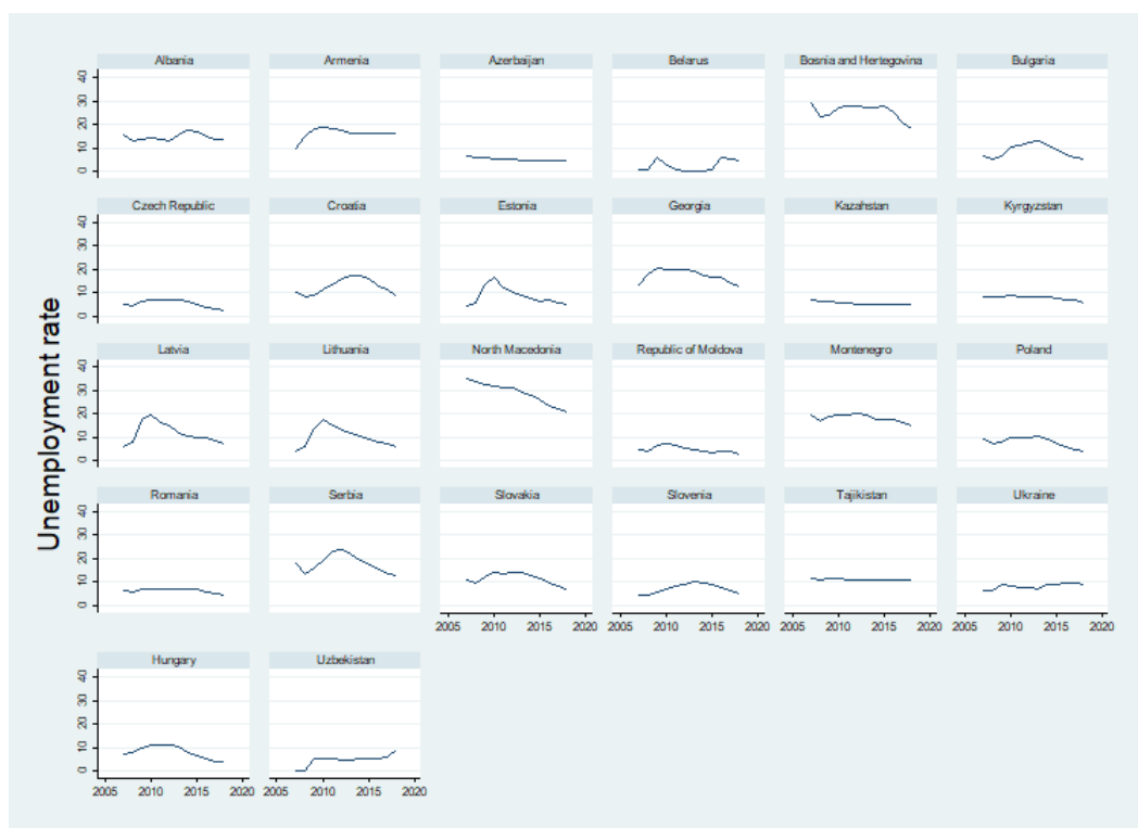
Graficul 3. Evoluția ratei șomajului în fostele state socialiste în perioada 2007-2018, %

Sursa: Rezultate generate prin utilizarea limbajului de programare STATA