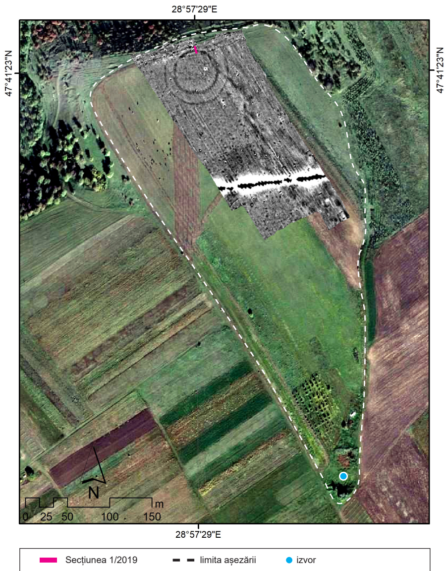
Fig. 1. Saharna „Rude”. Harta magnetometrică suprapusă peste imaginea ortorectificată.