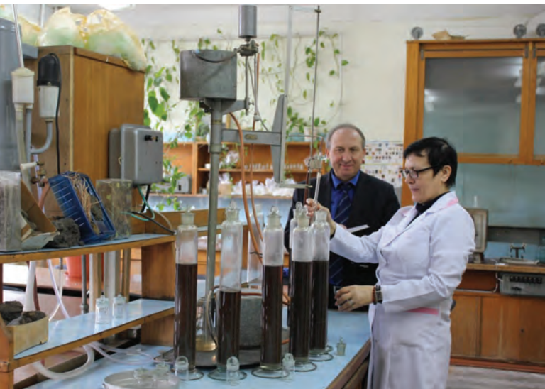
Fig. 3. Analiza texturii solului prin metoda N.A. Kacinski în laboratorul „Fizica solului” (Universitatea de Stat din Moldova). Fig. 3. Soil texture analysis by N.A. Kachinski’s method in the Laboratory of Soil Physics (Moldova State University).

Rezultatele analizelor de laborator, prezentate în Tabelul 1 , reflectă faptul că densitatea fazei solide a solului, care reprezintă raportarea masei la volumul solului, se încadrează, în ansamblu, în limite acceptabile. Însă, legitatea generală de creștere a valorii spre adâncime este perturbată în straturile 30-100 cm, unde putem presupune că valorile mai mici se datorează ponderii sporite a părții organice, care este mai ușoară (vezi cifrele subliniate).